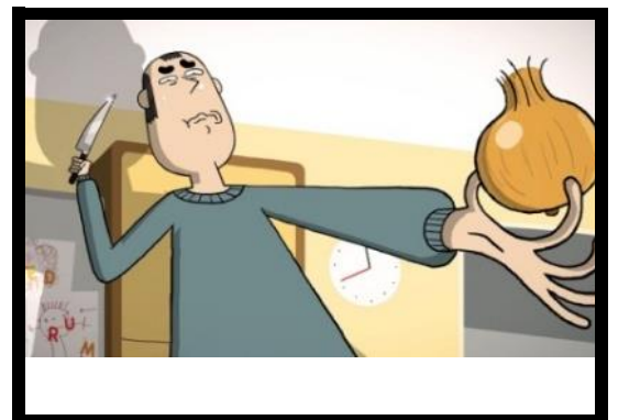
« Les hommes ne savent pas faire la cuisine ! Pourquoi ? »

Pendant trois semaines, le dispositif média mixera visibilité et engagement à travers la diffusion de trailers et d'épisodes sur les grands carrefours d'audiences, Youtube et Facebook .