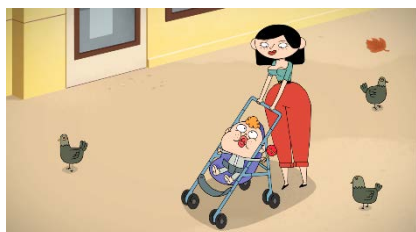
« Les femmes n'ont pas le sens de l'orientation ! Pourquoi ? »

« Faire évoluer le regard sur le crédit est la signature de Cofidis. Grâce à l'humour, nous déconstruisons les préjugés pour nouer sur la durée une relation de transparence et de proximité avec nos clients. Nous nous réjouissons d'ailleurs d'avoir été élus pour la troisième fois « Service Client de l'Année* » dans la catégorie 'organismes de crédit. Cette récompense est pour nous la meilleure preuve de la confiance que nous accordent nos clients au fil des ans. »