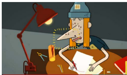
« Les jeunes sont de gros flemmards ! Pourquoi ? »