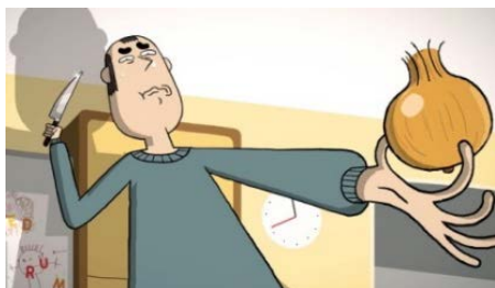
« Les hommes ne savent pas faire la cuisine ! Pourquoi ? »