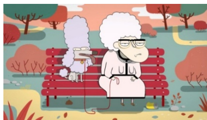
« Les mamies ont toujours des caniches ! Pourquoi ? »